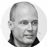
Dr. Bertrand Piccard, Initiator, Chairman & Pilot | Initiateur, Président & Pilote, Solar Impulse