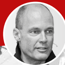
Dr. Bertrand Piccard, Initiator, Chairman & Pilot | Initiateur, Président & Pilote, Solar Impulse